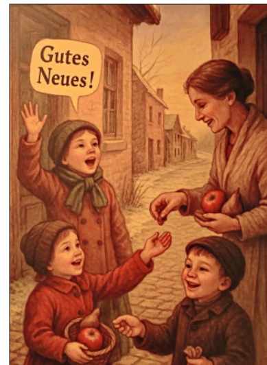
Kinder freuten sich über einen Apfel, wenn sie ein gutes neues Jahr wünschten.