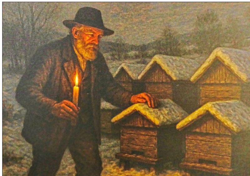
Mit einer geweihten Lichtmesskerze umrundeten die Bauern in Tschechien ihre Bienenstöcke.