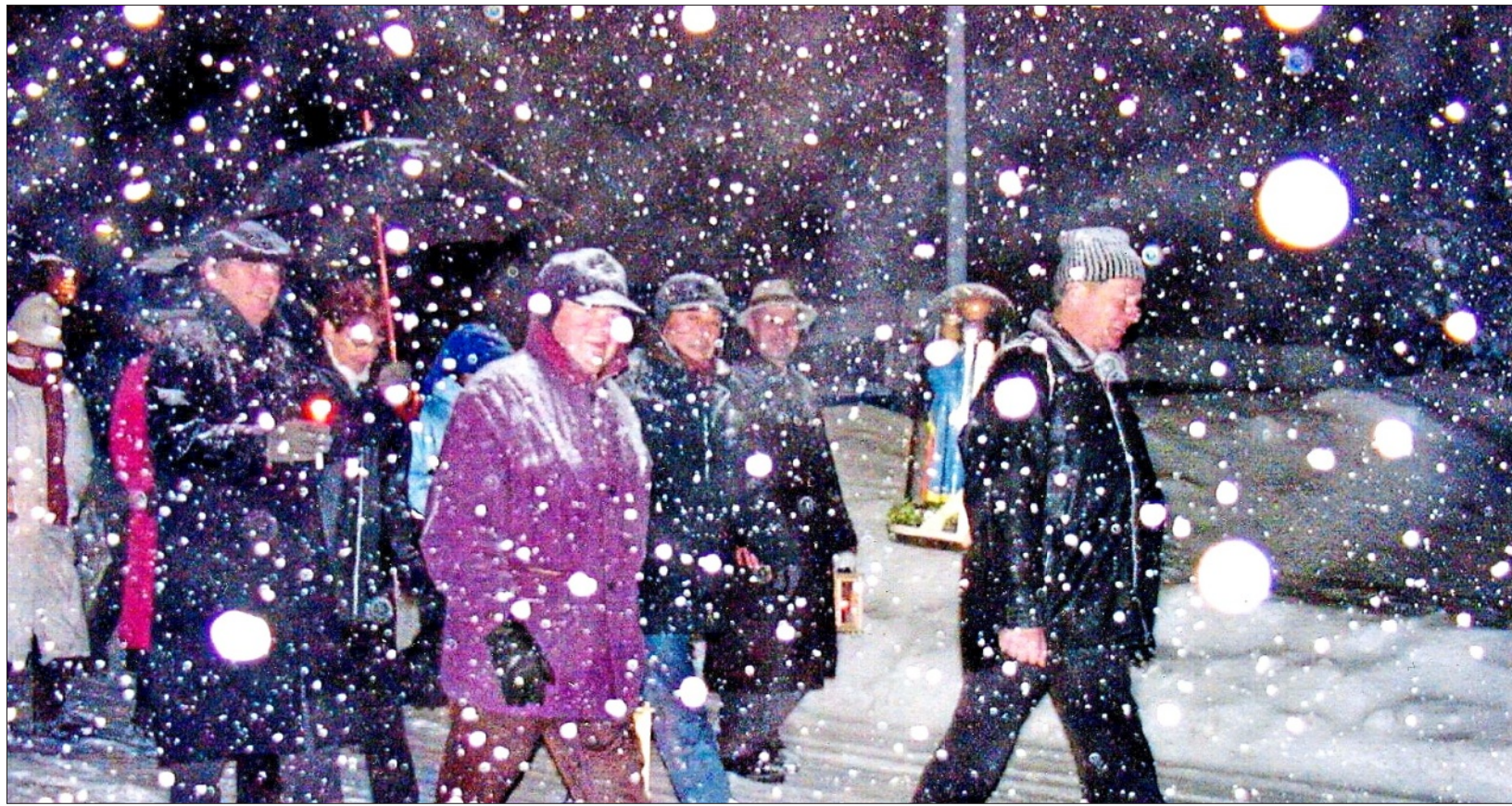
In der Adventszeit wird mancherorts im Bayerischen Wald das Christkind noch immer von Haus zu Haus getragen.

Es durfte weder etwas verliehen, noch verschenkt werden, sonst lief das Glück aus dem Haus. Nach einem Eintrag in der Pfarrchronik Stožec im Jahr 1907 durfte man in der Nacht keinen Namen eines Verstorbenen aussprechen, sonst erschien er in der Türe. Auf die Türschwelle und an die Fenster wurde Salz gestreut, damit die Geister nicht ins Haus kamen. Ein Kohlestück aus dem Ofen wurde als Schutz vor Krankheit unter der Schwelle verborgen. Unter den Tisch legte man ein Messer zum Schutz des Eigentums. Ein Besen wurde hinter die Türe gestellt, damit im neuen Jahr keine Unord-