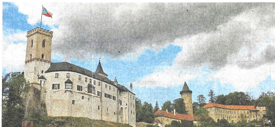
Die Burg Rozmberk (Rosenberg) thront hoch über der Moldau.

auch buchstäblich über d' Grenz“ nach Bayerisch Eisenstein.